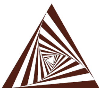
Figura 1: Construção de F. Grignani.

A estimulação emocional no trabalho intelectual fortalece e mantém o interesse e participação, facilita a prática inteligente para focar em certos pontos de interesse e ignorar o que é estranho aos elementos que formam o objeto de atenção, leva a assumir uma atitude de pesquisar o que a mensagem visual propõe e pesquisar as várias fases processual que o compõe, juntamente com o interesse pelas ferramentas e conhecimento básico que permite reproduzi-lo. Por exemplo, dá satisfação desenhar, recriando esse movimento envolvente.