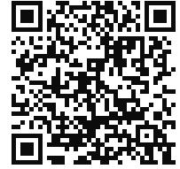
QR-Code Kosinusgraph erkunden

Der Punkt P (das "Bleistiftende") startet wieder rechts außen und wandert entgegen dem Uhrzeigersinn auf dem Einheitskreis. Öffne die Aktivität Kosinusgraph entdecken und schau dir die Animation der Pendelbewegung des Bleistiftschattens an. Die beim Hin- und Herpendeln auftretenden Kosinuswerte werden nun wie zuvor beim Sinus für eine volle Kreisum-